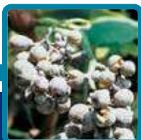
Oidio della Vite

La consultazione della scheda non sostituisce una attenta lettura dell'etichetta del prodotto.