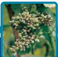
Peronospora della Vite

La consultazione della scheda non sostituisce una attenta lettura dell'etichetta del prodotto.